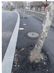
Via Ciani, davanti al Macello

Nei vari cantieri privati e pubblici si vedono situazioni che mettono a rischio gli alberi, per esempio l'asfalto steso e compattato fino a pochi centimetri dal tronco.